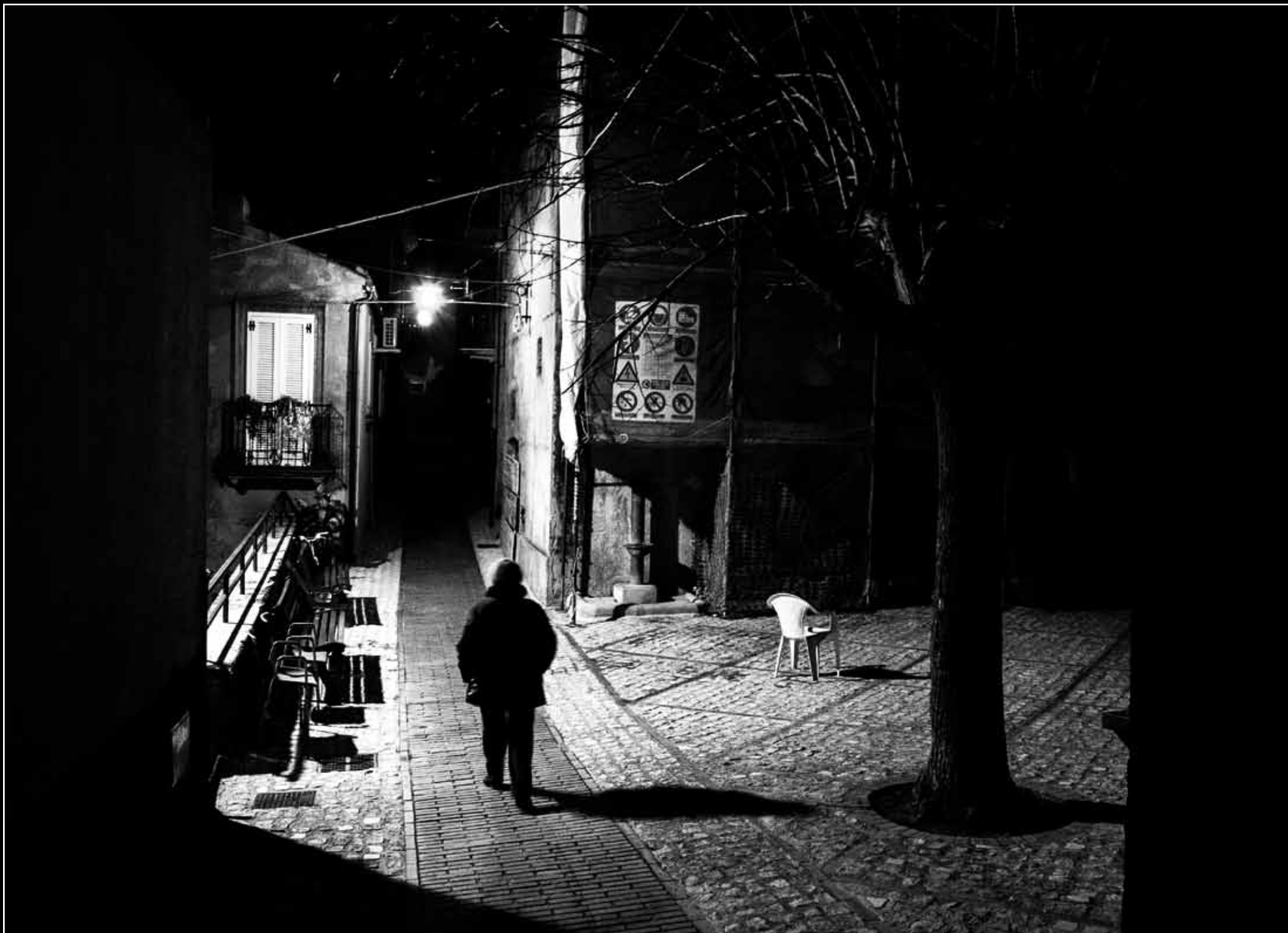
GIANNICOLA MENNA Santa Croce - Atessa 2° CLASSIFICATO