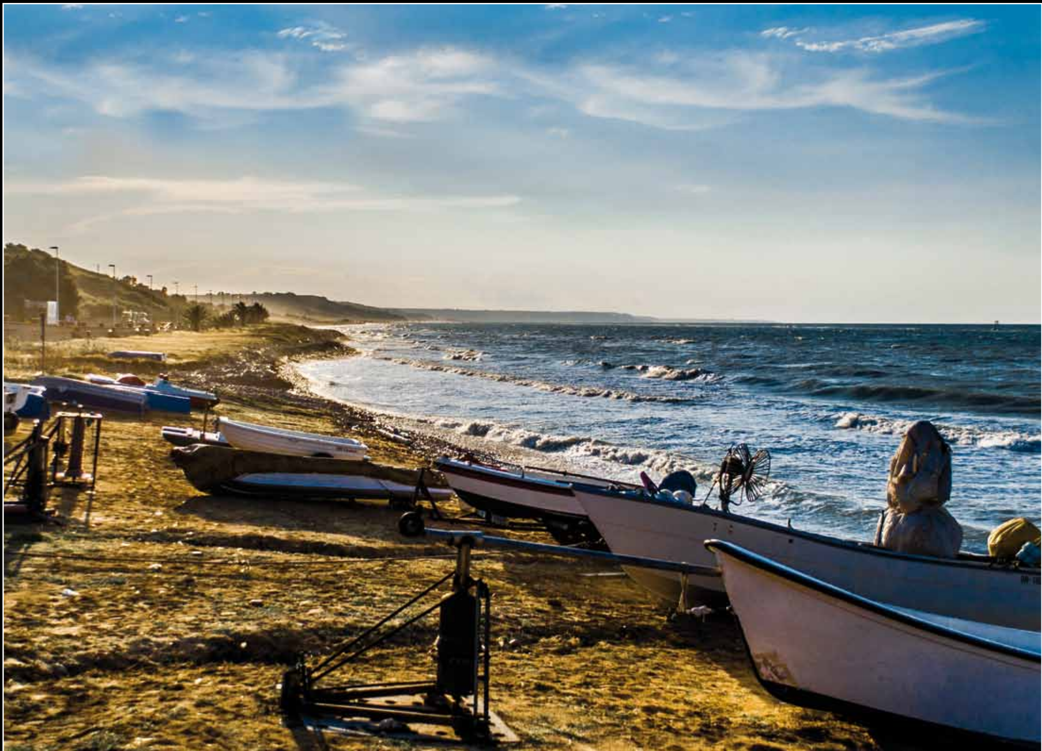
GESSICA TANO Spiaggia - Casalbordino